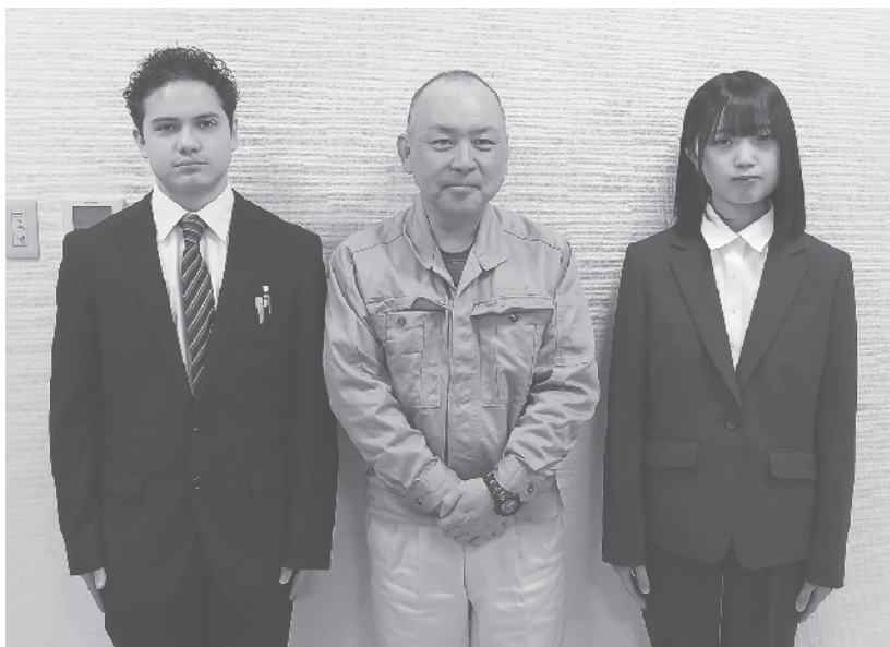
永田工場長と新入社員