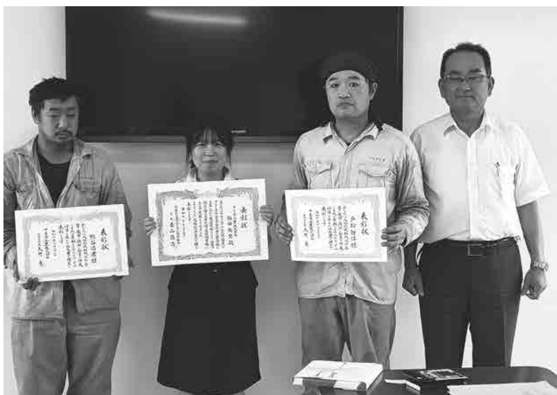
社員 勤続 表彰 総会