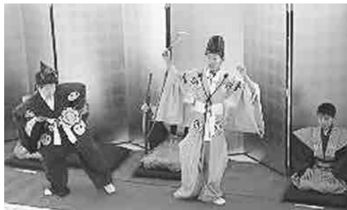
平成はじめ頃

平成8年に安城市・幸田町の万歳とともに「三河万歳」として国の無形民俗文化財に指定されていました。