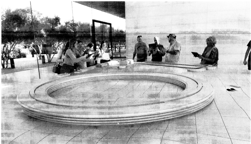
アップルパークビジターセンター（アップル本社社屋の模型）