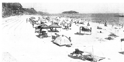
寺部海水浴場（寺部町）