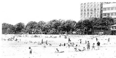
恵比寿海水浴場（吉良町）