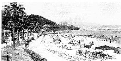
宮崎海水浴場（吉良町）