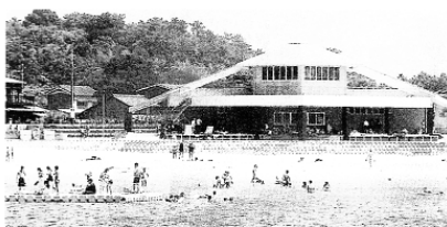
佐久島大浦海水浴場（一色町）