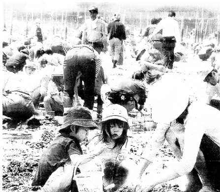
〔西尾観光ガイドマップより〕

西尾市は積極的に宣伝中で、お問い合わせは西尾市観光協会（電話0563-65-2169番）へ。ただし、干潮時刻と天候により、交通渋滞の起る可能性があり、ご注意のほど。